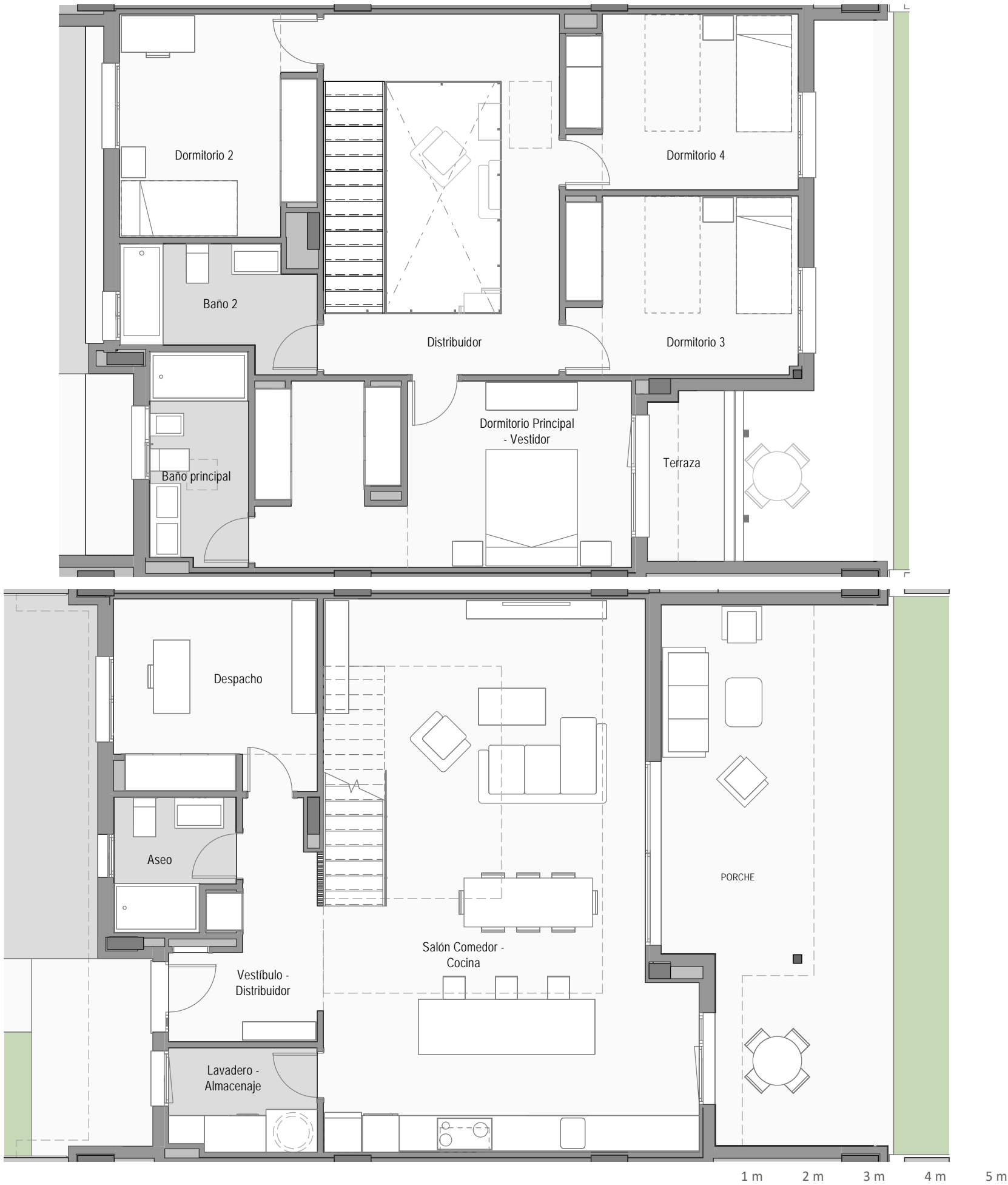
Vivienda Nº 11 - Tipo Ba

La información aquí contenida puede ser modificada durante el transcurso de la ejecución de la obra por exigencias técnicas o jurídicas, sin que ello implique menoscabo en el nivel global de calidades. El mobiliario, incluido el de cocina y lavadero, se refleja a efectos meramente decorativos, sin que se incluya en la oferta. Los peldaños de acceso a la vivienda y salidas a patios, puede alterarse en función de la rasante de las calles y corresponde a la D.F. fijar el criterio.